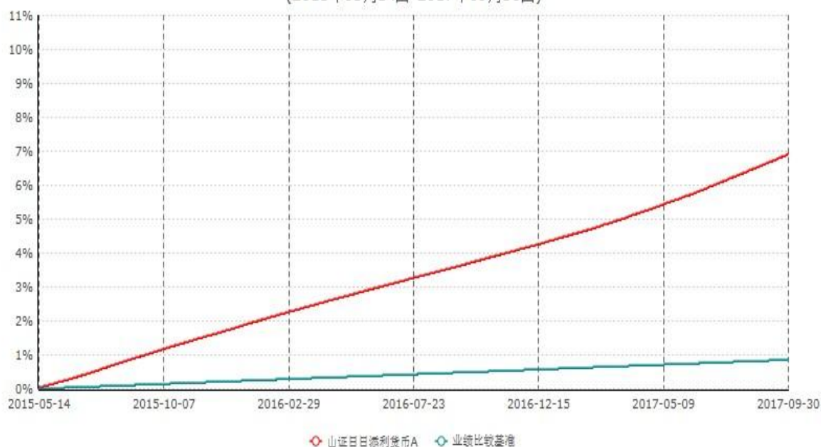
山证日日添利货币A累计净值收益率与业绩比较基准收益率历史走势对比图 (2015年05月14日-2017年09月30日)