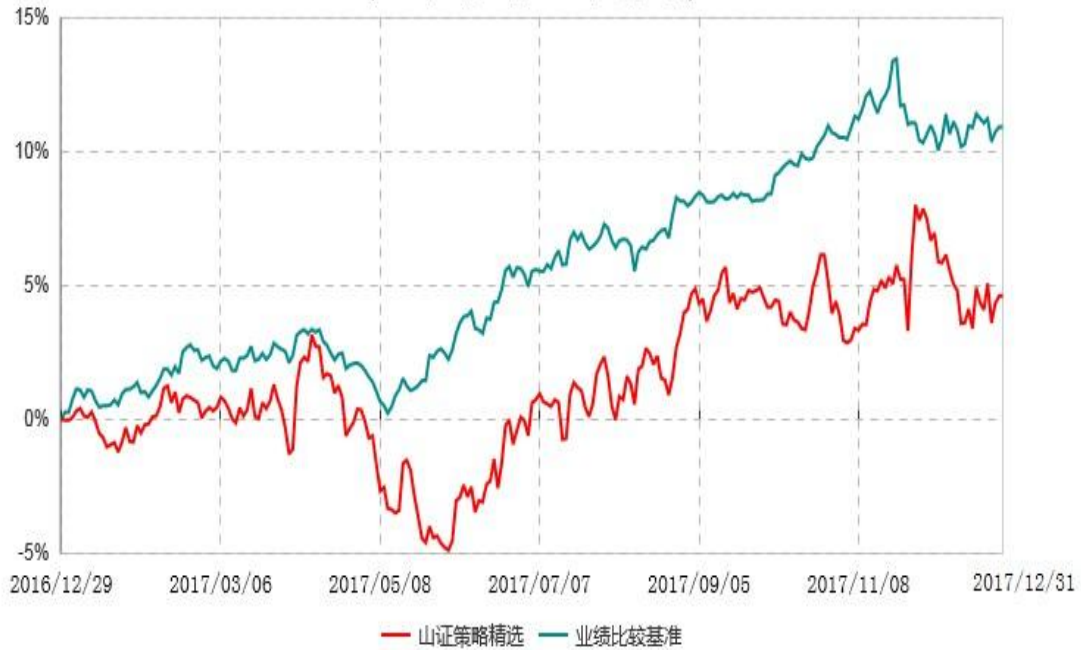
山西证券策略精选灵活配置混合型证券投资基金累计净值增长率与业绩比较基准收益率历史走势对比图 (2016年12月29日-2017年12月31日)