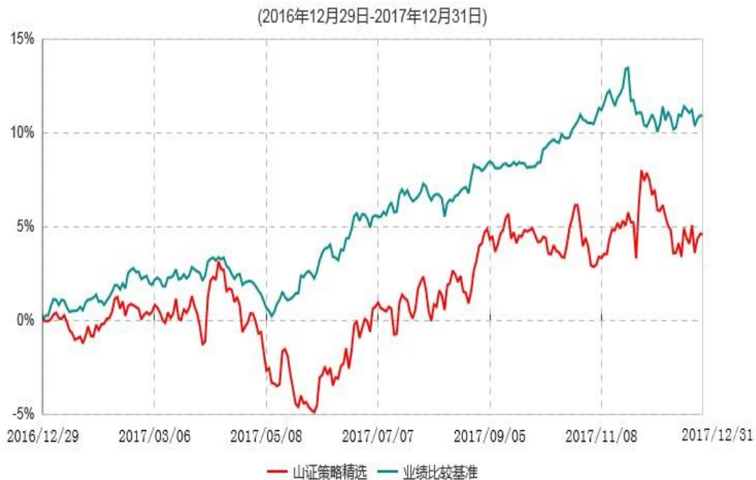
山西证券策略精选灵活配置混合型证券投资基金累计净值增长率与业绩比较基准收益率历史走势对比图

注：1、本基金基金合同生效日为2016年12月29日； 2、按基金合同和招募说明书的约定，基金管理人自基金合同生效之日起六个月内使基金的各项资产配置比例符合基金合同的有关约定。建仓期结束时各项资产配置比例符合基金合同的有关约定。