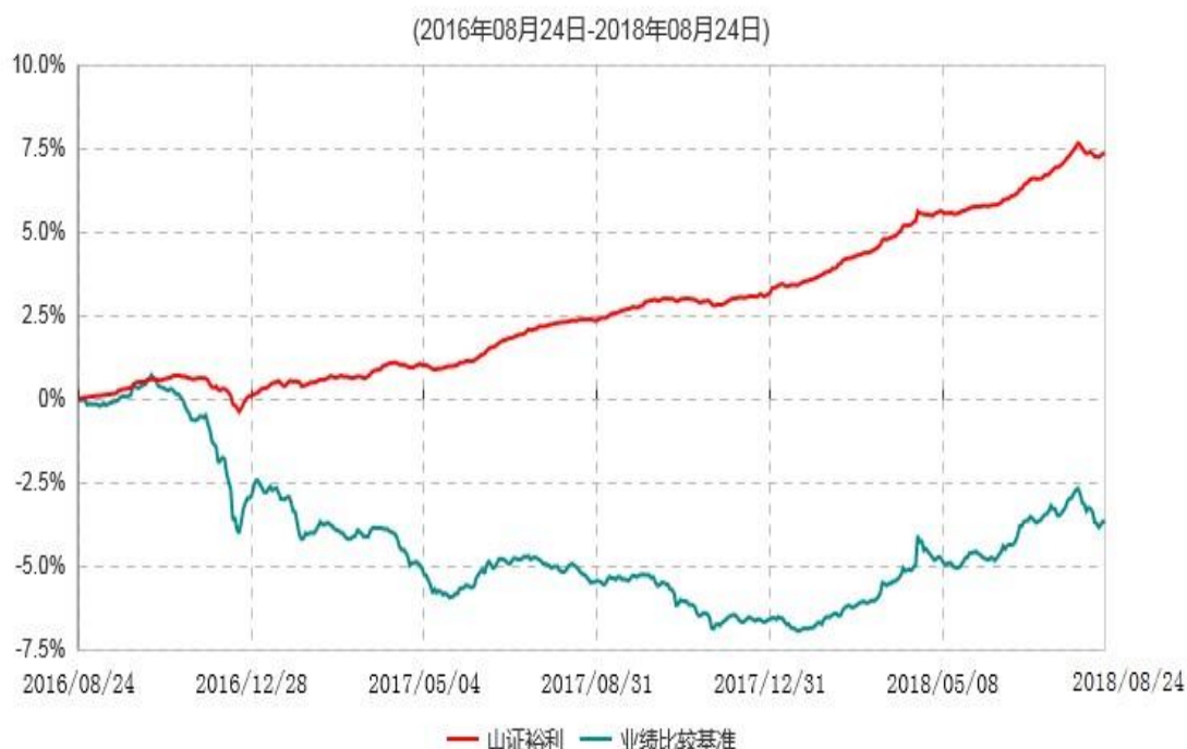
山西证券裕利债券型证券投资基金累计净值增长率与业绩比较基准收益率历史走势对比图

注：按基金合同和招募说明书的约定，本基金的建仓期为基金合同生效之日起六个月，建仓期结束时各项资产配置比例符合基金合同的有关约定。