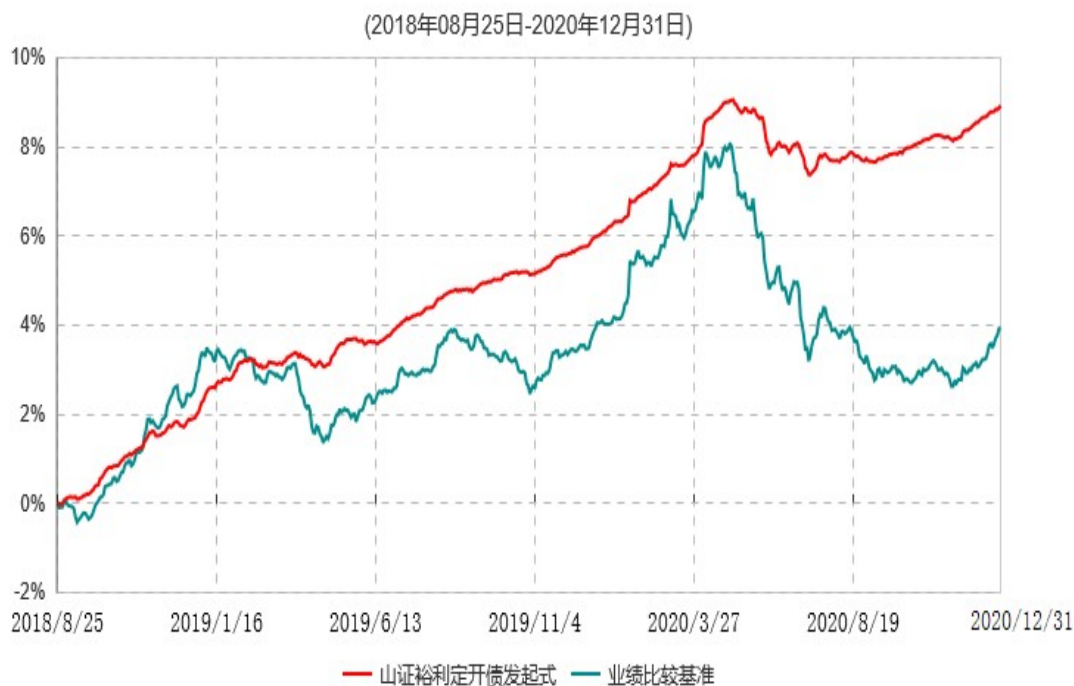
山西证券裕利定期开放债券型发起式证券投资基金累计净值增长率与业绩比较基准收益率历史走势对比图