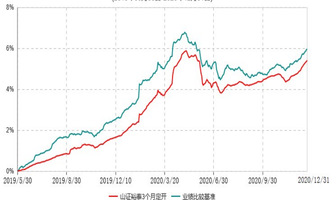
山西证券裕泰3个月定期开放债券型发起式证券投资基金累计净值增长率与业绩比较基准收益率历史走势对比图 (2019年05月30日-2020年12月31日)