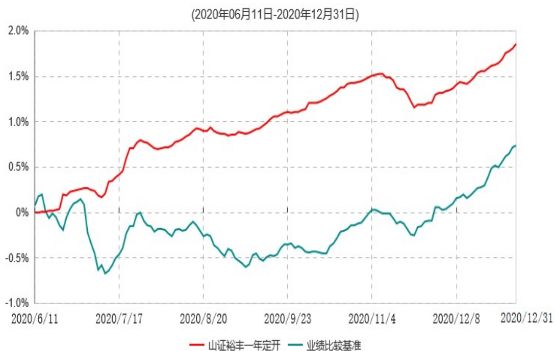
山西证券裕丰一年定期开放债券型发起式证券投资基金累计净值增长率与业绩比较基准收益率历史走势对比图