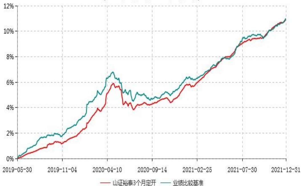
山西证券裕泰3个月定期开放债券型发起式证券投资基金累计净值增长率与业绩比较基准收益率历史走势对比图 (2019年05月30日-2021年12月31日)