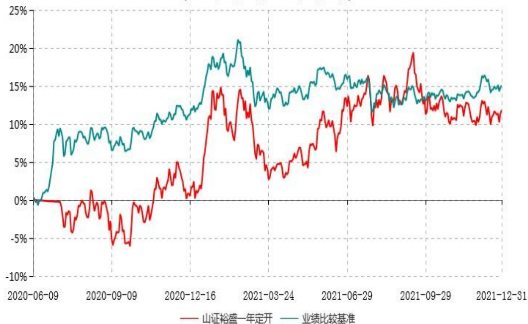
山西证券裕盛一年定期开放灵活配置混合型发起式证券投资基金累计净值增长率与业绩比较基准收益率历史走势对比图 (2020年06月09日-2021年12月31日)