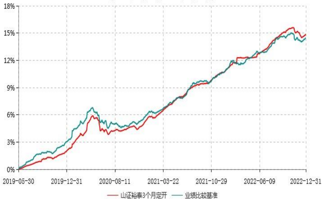
山西证券裕泰3个月定期开放债券型发起式证券投资基金累计净值增长率与业绩比较基准收益率历史走势对比图 (2019年05月30日-2022年12月31日)