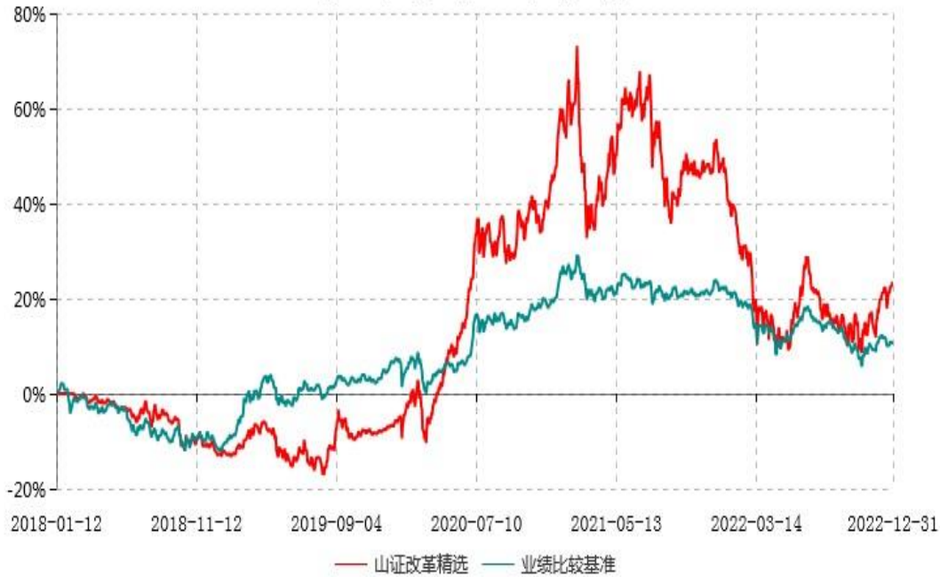
山西证券改革精选灵活配置混合型证券投资基金累计净值增长率与业绩比较基准收益率历史走势对比图 (2018年01月12日-2022年12月31日)

按照本基金的基金合同规定，自基金合同生效之日起6个月内使基金的投资组合比例符合本基金合同的有关约定。建仓期结束时各项资产配置比例符合基金合同的有关约定。