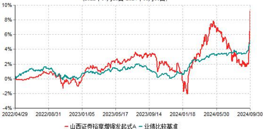
山西证券裕享增强发起式A累计净值增长率与业绩比较基准收益率历史走势对比图 (2022年04月29日-2024年09月30日)