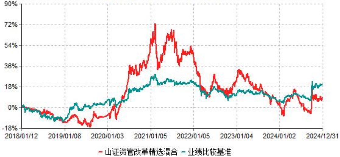
山证资管改革精选灵活配置混合型证券投资基金累计净值增长率与业绩比较基准收益率历史 走势对比图 (2018年01月12日-2024年12月31日)