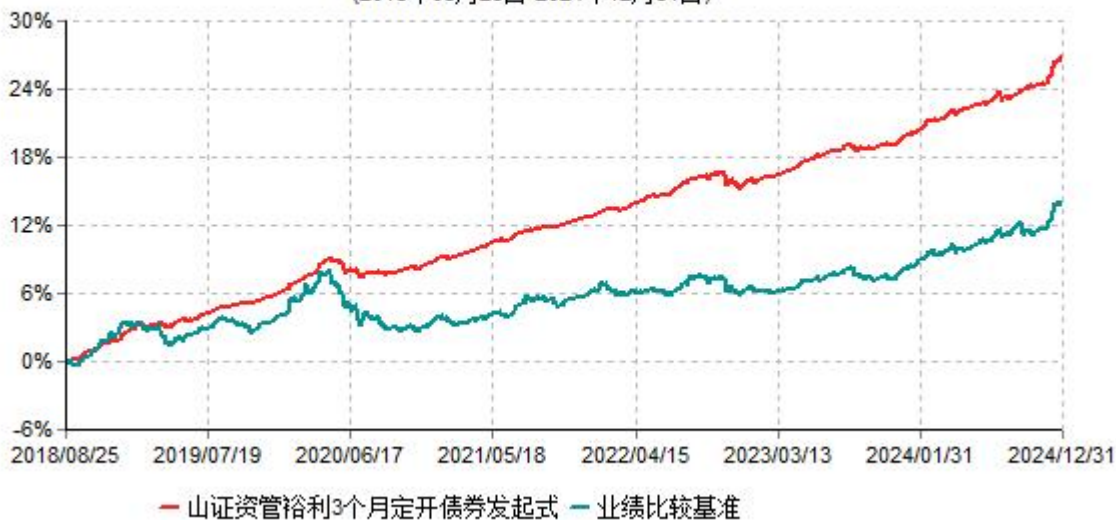
山证资管裕利定期开放债券型发起式证券投资基金累计净值增长率与业绩比较基准收益率历史走势对比图 (2018年08月25日-2024年12月31日)

1、按基金合同和招募说明书的约定，本基金建仓期为自基金合同生效之日起六个月，建仓期结束时各项资产配置比例符合基金合同的有关约定。